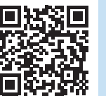
(大会ホームページ)